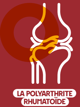
LA POLYARTHRITE RHUMATOÏDE