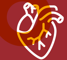
LES MALADIES CARDIOVASCULAIRES

En 2016, des études cliniques interrogeaient la corrélation entre les maladies parodontales et 57 maladies systémiques.