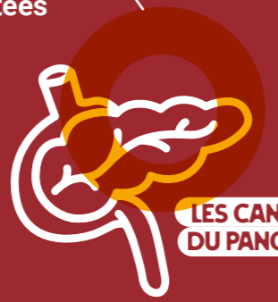
LES CANCERS DU PANCRÉAS

Entre 2020 et 2022, leur incidence possible s'est révélée sur sept pathologies, parmi lesquelles trois s'avèrent fortement impactées et de manière très précise.