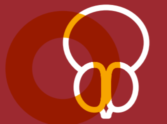
LES CANCERS DE LA PROSTATE