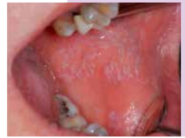
Lichen planus orale

L'OL è definita come una lesione bianca della mucosa che non può essere ascritta a nessuna condizione benigna nota nella quale il carcinoma è molto più probabile che si sviluppi rispetto ad una zona con normali caratteristiche. La prevalenza di questa patologia è del 2,6% e il tasso di conversione in malignità varia dallo 0,1% al 17,5%.